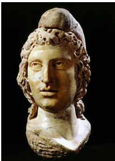
Römische Statue von Mithra